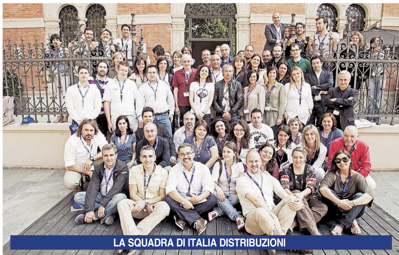
LA SQUADRA DI ITALIA DISTRIBUZIONI

Head Office Via Monsignor Anacleto Cazzaniga, 61 20064 Gorgonzola (MI) Tel. 02.30303901 Fax. 02.30303933 www.italdi.it info@italdi.it